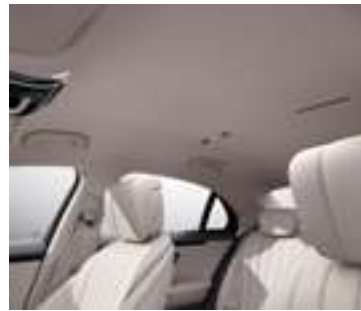
55U - Beige Macchiato Selon sellerie