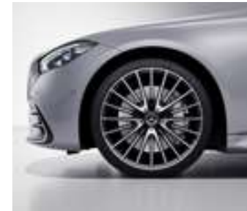
RWN* - Jantes alliage AMG de 21" multibranches