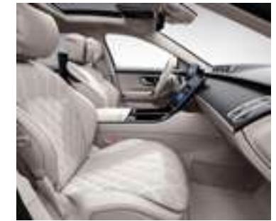
505A - Beige Macchiato/ gris Magma Inclus avec P34 - Pack Exclusif