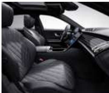
801A - Noir Option