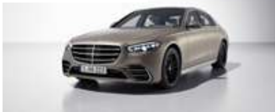
677U - Or Kalahari magno Manufaktur