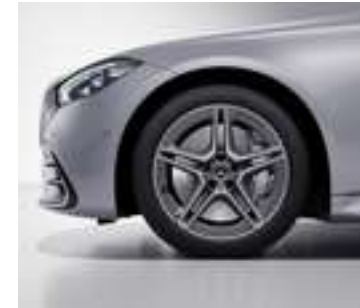
RRG - Jantes alliage AMG de 19" à 5 doubles branches