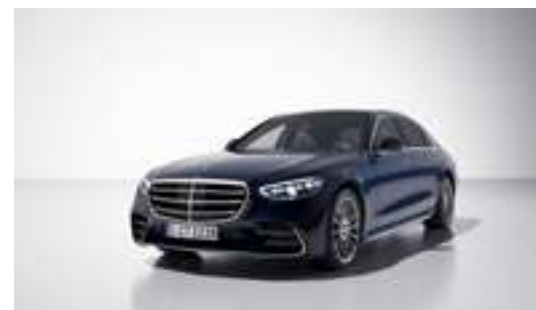
■ Métallisée 595U - Bleu nautique