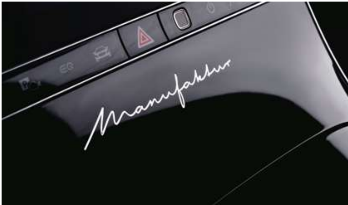
Monogramme MANUFAKTUR aspect chrome brillant