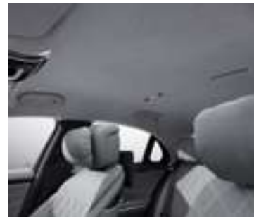
68U - Gris neva Inclus avec P34