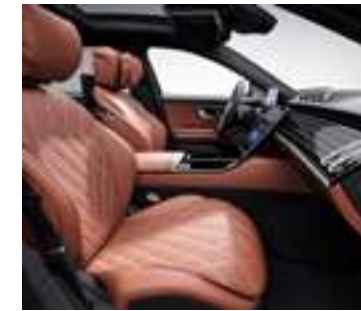
504A - Marron Sienne/ noir Inclus avec P34 - Pack Exclusif