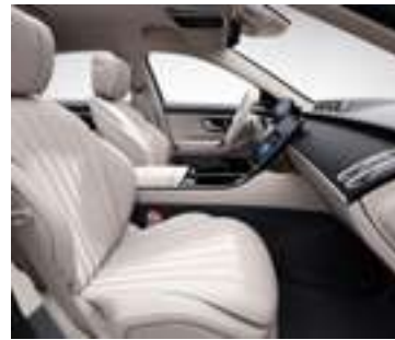
205A - Beige Macchiato/ gris Magma Option