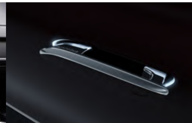
889 - KEYLESS-GO avec poignées de porte encastrées