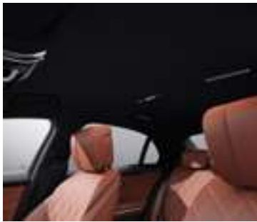
51U - Noir Selon sellerie