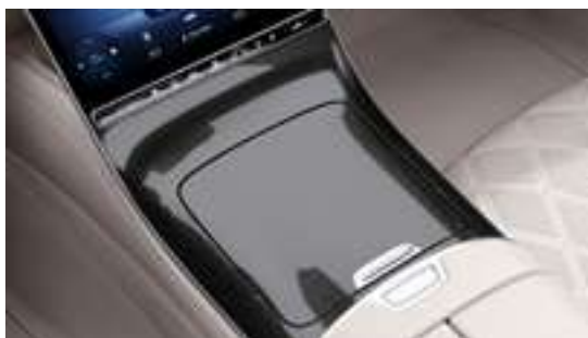
722 - Console centrale design metal/ tissu noir brillant Option*