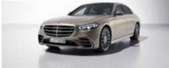
802U - Or Kalahari métallisé Manufaktur