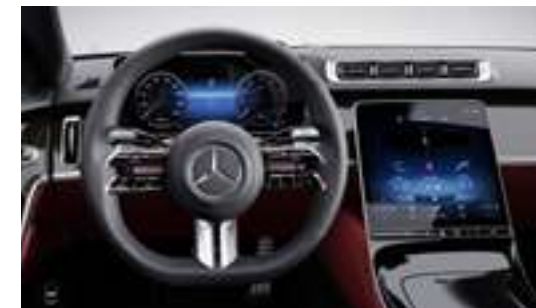
L5C - Volant sport multifonctions, en cuir Nappa - Option/Série

*Indisponible avec inserts à pores ouverts.