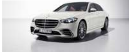
799U - Blanc diamant bright Manufaktur