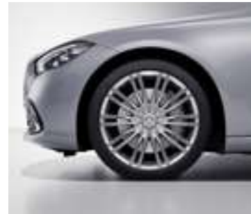
R73 - Jantes alliage de 20" à 10 doubles branches