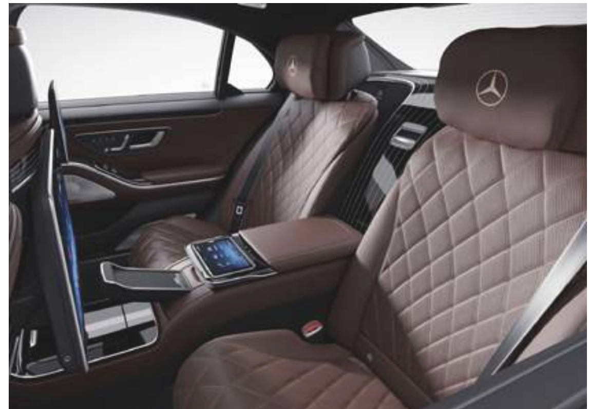
954A - Sellerie spéciale en cuir Nappa Exclusif Marron noix/noir MANUFAKTUR