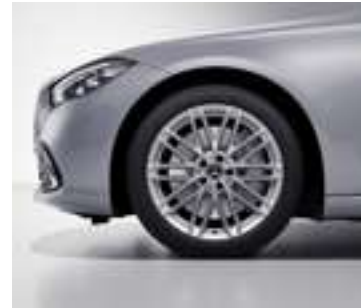
R15R - Jantes alliage de 19" Multibranches