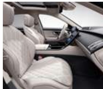
805A - Beige Macchiato/ gris Magma Option