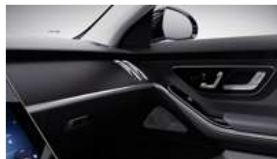
H02 - Inserts en peuplier, anthracite à pores ouvert Série