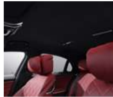
61U - Noir Inclus avec P34