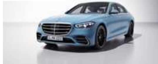
934U - Bleu vintage Manufaktur