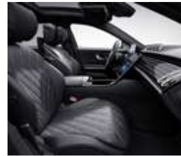
501A - Noir Inclus avec P34 - Pack Exclusif