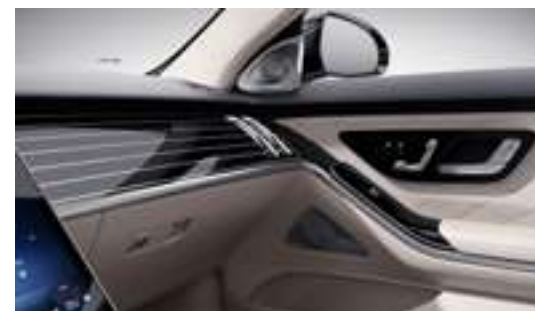
H17 - Inserts Manufaktur en finition laque noire avec des lignes fluides Option