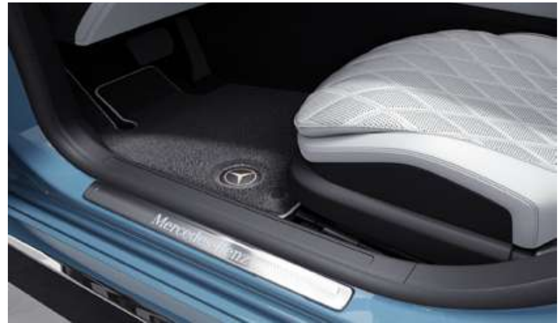
Tapis de sol à poils longs avec logo brodé