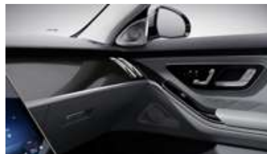
H75 - Inserts design metal/tissu noir brillant Option