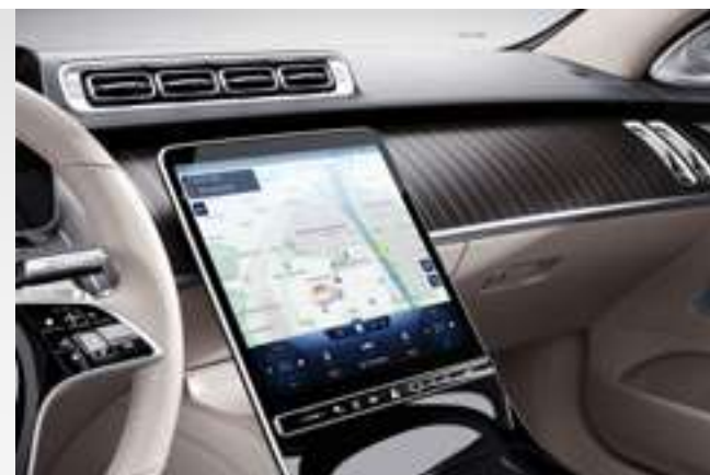
868 - Ecran tactile OLED de 12,8"