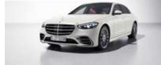
049U - Blanc cachemire magno Manufaktur