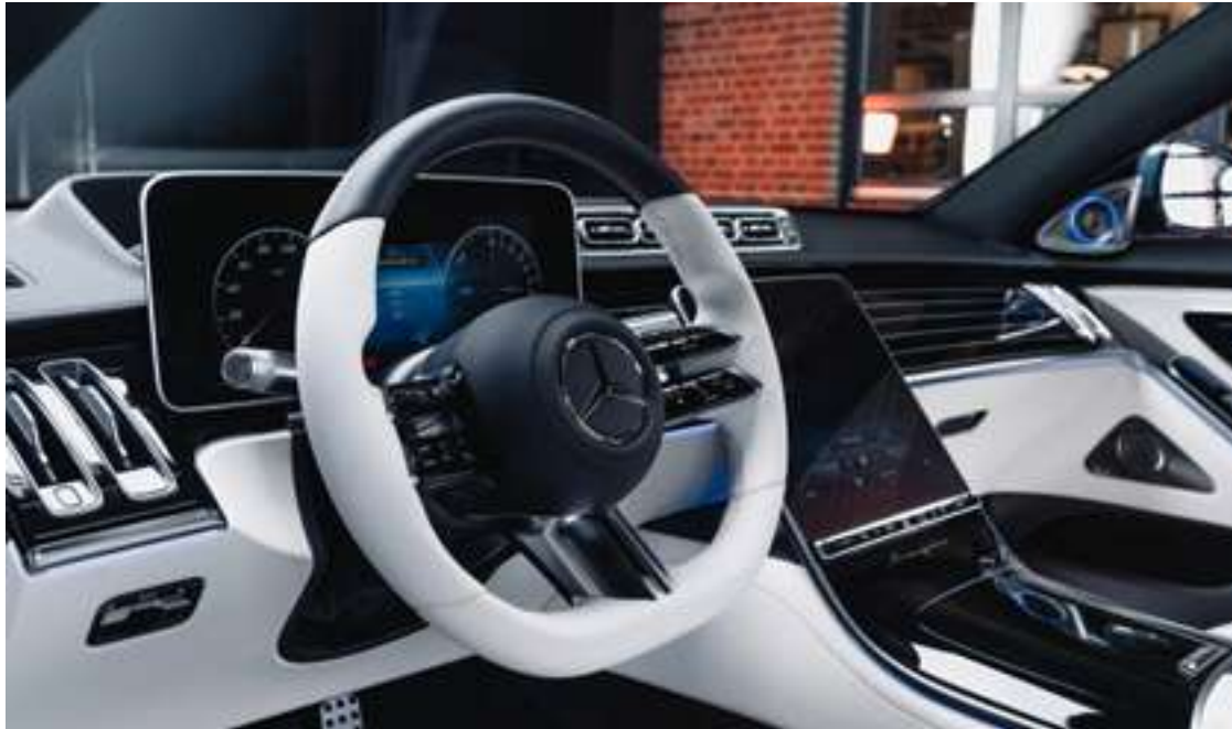
Volant bicolore en cuir Nappa