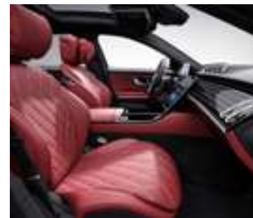
507A - Rouge Grenat/ noir Inclus avec P34* - Pack Exclusif