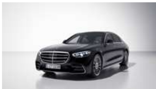
■ Métallisée 197U - Noir obsidienne