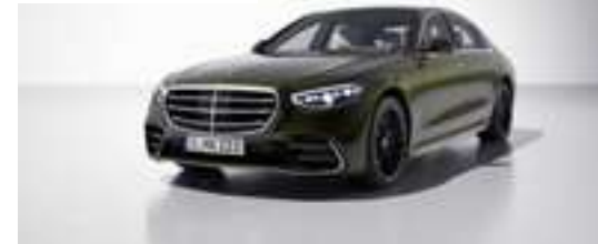
255U - Olive métallisé Manufaktur