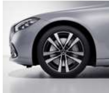
R55 - Jantes alliage de 19" à 5 doubles branches