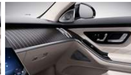
H38 - Inserts Manufaktur en noyer marron à pores ouverts, avec lignes en aluminium Option