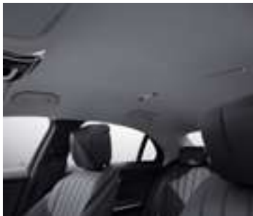
58U - Gris neva Selon sellerie