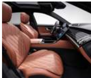
804A - Marron Sienne/ noir Option