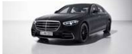
056U - Noir nocturne magno Manufaktur