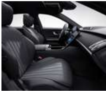
201A - Noir Série