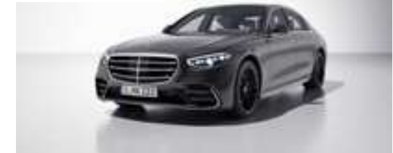
041U - Graphite métallisé Manufaktur