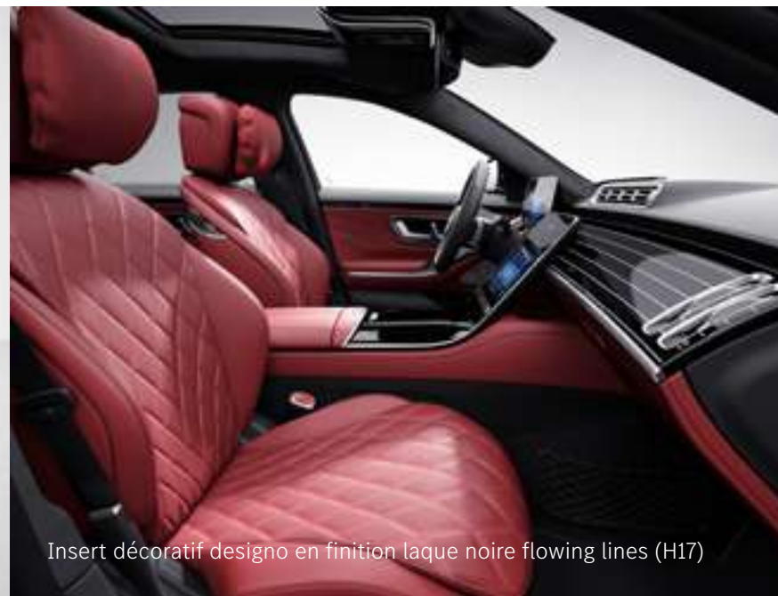
Insert décoratif designo en finition laque noire flowing lines (H17)