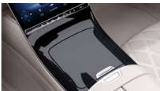
797 - Console centrale en imitation verre pointillé noir Option