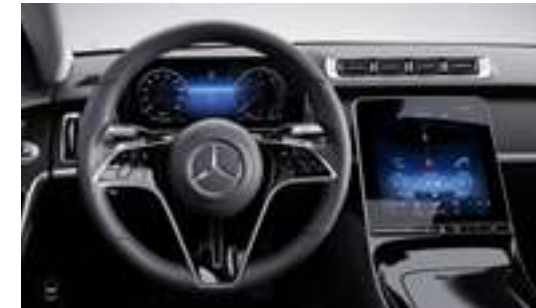
L2B - Volant cuir Nappa multifonctions Série