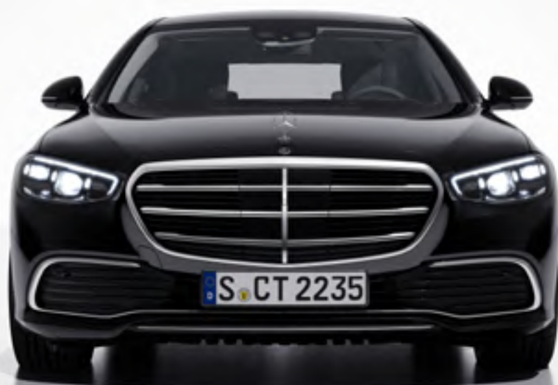
Jupe avant, latérales et arrière avec inserts en chrome