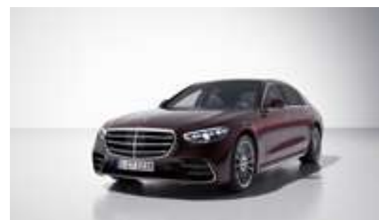
■ Métallisée 660U - Rouge rubélite