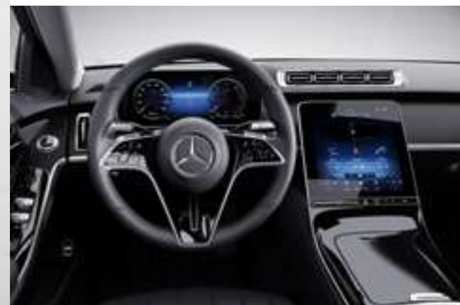
L2B - Volant multifonctions en cuir Nappa