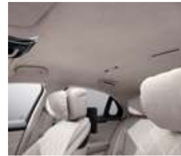
65U - Beige Inclus avec P34