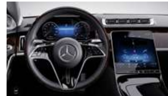
L2D - Volant cuir/bois multifonctions Option