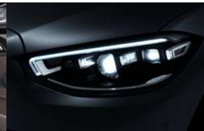
642 - MULTIBEAM LED