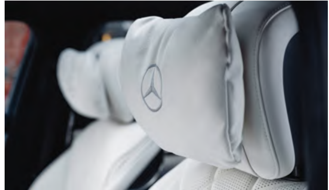
Logo Mercedes-Benz brodé sur les appuie-têtes