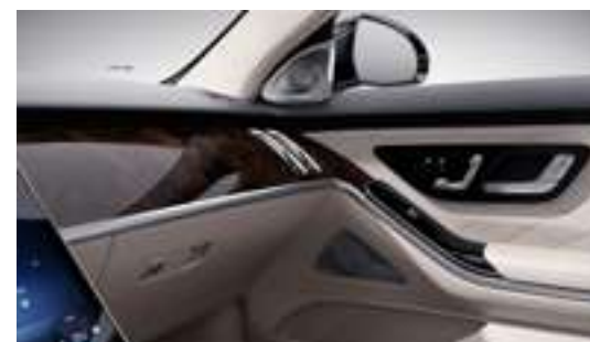
H29 - Inserts en noyer, marron brillant Option