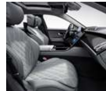
508A - Gris argent/ noir Inclus avec P34 - Pack Exclusif