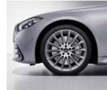
RVU/RVQ - Jantes alliage AMG de 20" multibranches