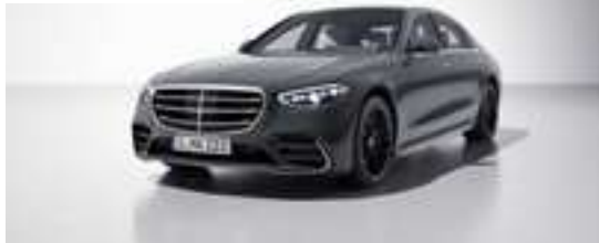
190U - Gris silicium Manufaktur