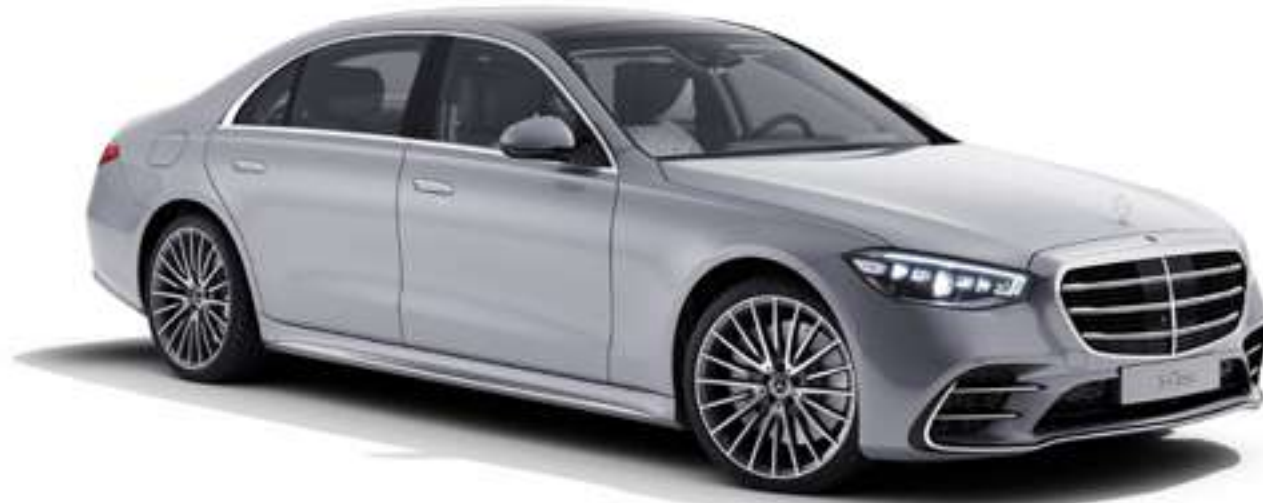
Peinture métallisée Argent High-Tech (922U) et Jantes alliage AMG 21" multibranches (RWK) et Digital Light optionnel.