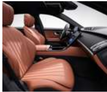
204A - Marron Sienne/noir Option