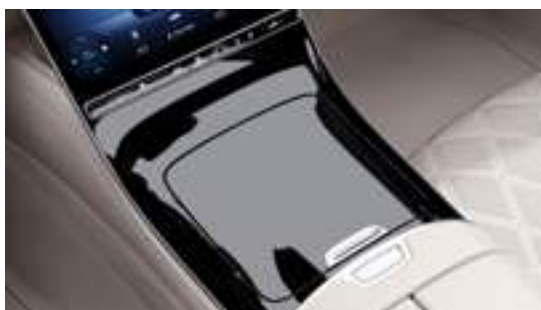
726 - Console centrale noir brillant Série