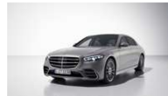
■ Métallisée 859U - Argent mojava