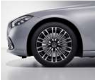
R60 - Jantes alliage de 19" multibranches