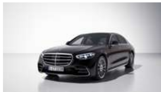
■ Métallisée 346U - Noir onyx