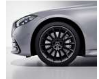
RVP/RVW - Jantes alliage AMG de 20" multibranches