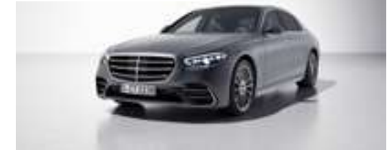
297U - Gris sélénite magno Manufaktur