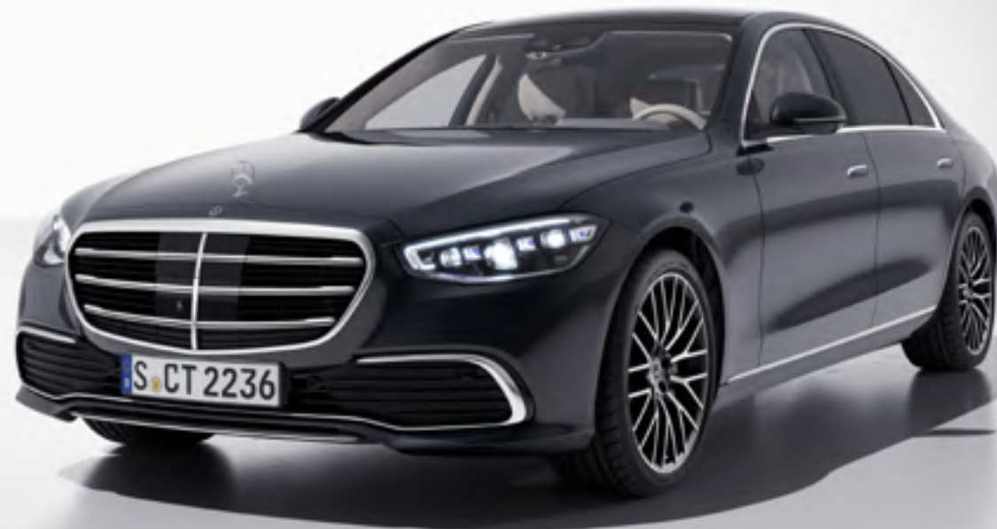
Classe S Business avec jantes alliage optionnelles 20" (60R)