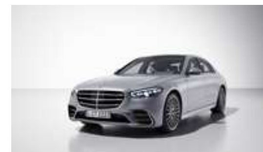
■ Métallisée 922U - Agent high-tech